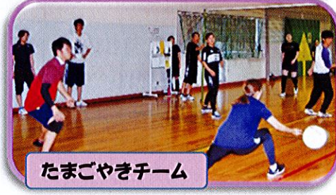
たまごやきチーム

目玉焼きチーム戦&たまごやきチーム戦、どちらも相手は強豪チームでしたがチーム一団となって頑張りました。