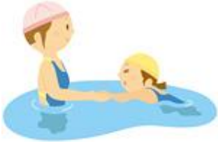
… 1期予定表 (16:50~18:50) …

▼問合せ 東山体育センター TEL80-0195 (豊田市宝来町4-758-10)