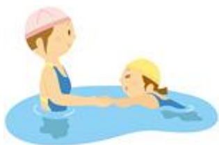
… 2期予定表 (16:50～18:50) …